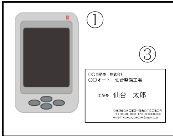
本体(表面)の写真例